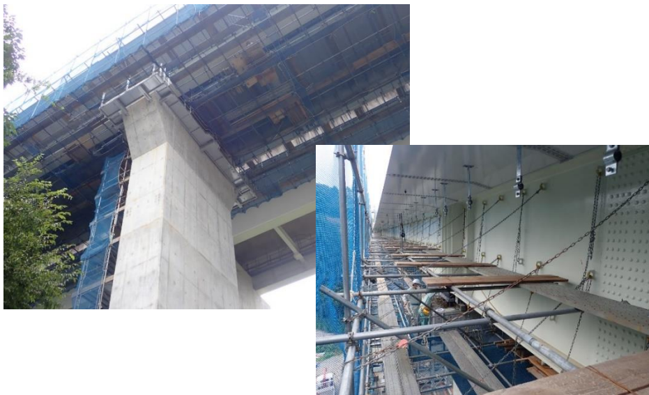
従来型のパイプ足場の一例